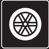
REIFEN &amp; FELGEN